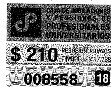
Cra. Gisella Divenuto CP. N° 131483